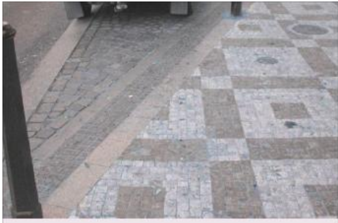
Vzorový varovný pás na rozhraní dvou typů komunikací